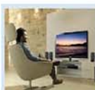
每天看电视3小时 会加大年轻人早逝 风险

据《美国心脏病学杂志》刊登的一项研究结果显示，每天看电视3小时，早逝的风险会增加一倍。