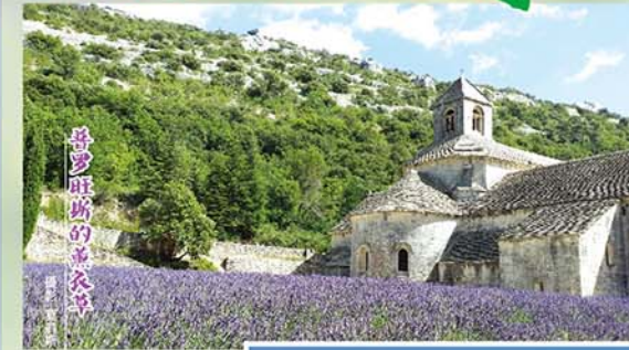
普罗旺斯的薰衣草