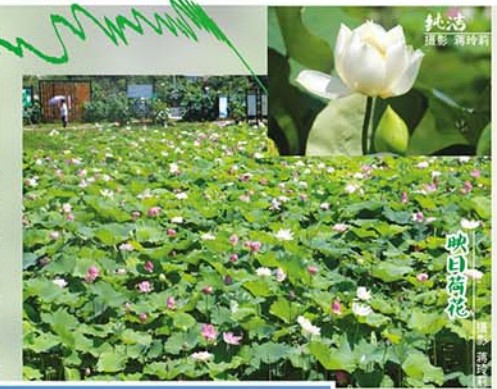
纯白荷花